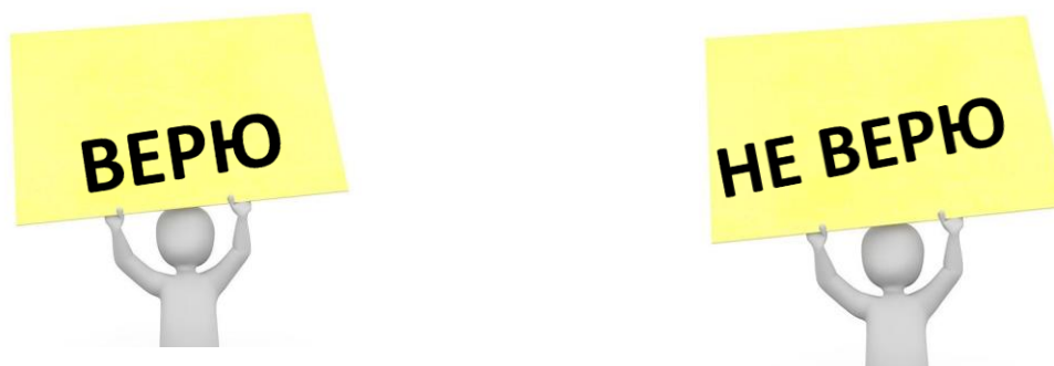
Рисунок 3. Карточки для приема «Верю-Не верю»